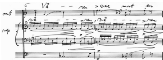
Fordell, Våren var mest en bitande blåst

Oli miten oli, kaikinainen Fordellin musiikin näkymättömäksi jäämisen selittely on nyt tietysti pelkkää spekulatiota.