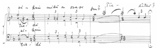
Linnala, Putosit, keltainen lehti

Uusi, kansallisromantiikkaa haastava 1950-luvun säveltäjäpolvi oli rohkea ja kokeileva etsiessään vaihtoehtoisia ilmaisutapoja. Kuorosatsit olivat harmonisesti ja rytmisesti aikaisempaa haastavampia. Tiheät, lukuisia stemmajakoja sisältävät partituurinsivut pakottivat etsimään perinteisestä kuoroäänennuodostuksesta poikkeavia laulutapoja. Intervallipuhautuden kirkastamiseksi moniääniset, usein sekuntisuhteiset soinnut tuli laulaa suoralla ja huojumattomalla äänellä. Tarkkaan kontrolloidut, vibratotonta äänenkäyttöihannetta toteuttavat esitykset ristittiin pian "haamulauluksi".