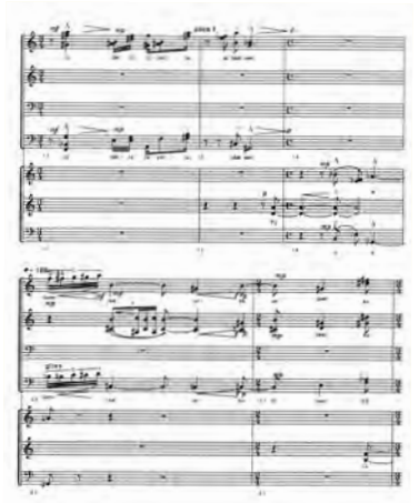
Paavo Heininen, Poetiikka 1986 / 1990