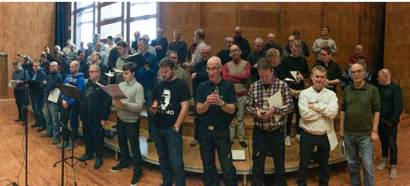
Suomessa syntynyt -levyn nauhoitus Kauniaisten Nya Paviljongen -salissa 2017

Laulu-Miesten 1930-luvulla kunniajäsenekseen kutsuman Eino Linnalan tuotannon valinta yhdeksi 2010-luvun musiikilliseksi painopistealueeksi oli kuitenkin osalle laulajista kuin Obama republikaaneille. Eräskin sui vaantunut kieltäytyi ehdottomasti viettämästä viimeisiä vuosiaan Linnala vierellään - päättäväisesti vain takki niskaan ja ovesta ulos. Ja niin ratsasti vuosikausia korporaatiota palvelleet laulajaveli kohti auringonlaskua. Sama veren maku suussa -performanssi muunnellineen toistui Erkki Melartinin ja Erik Fordellin