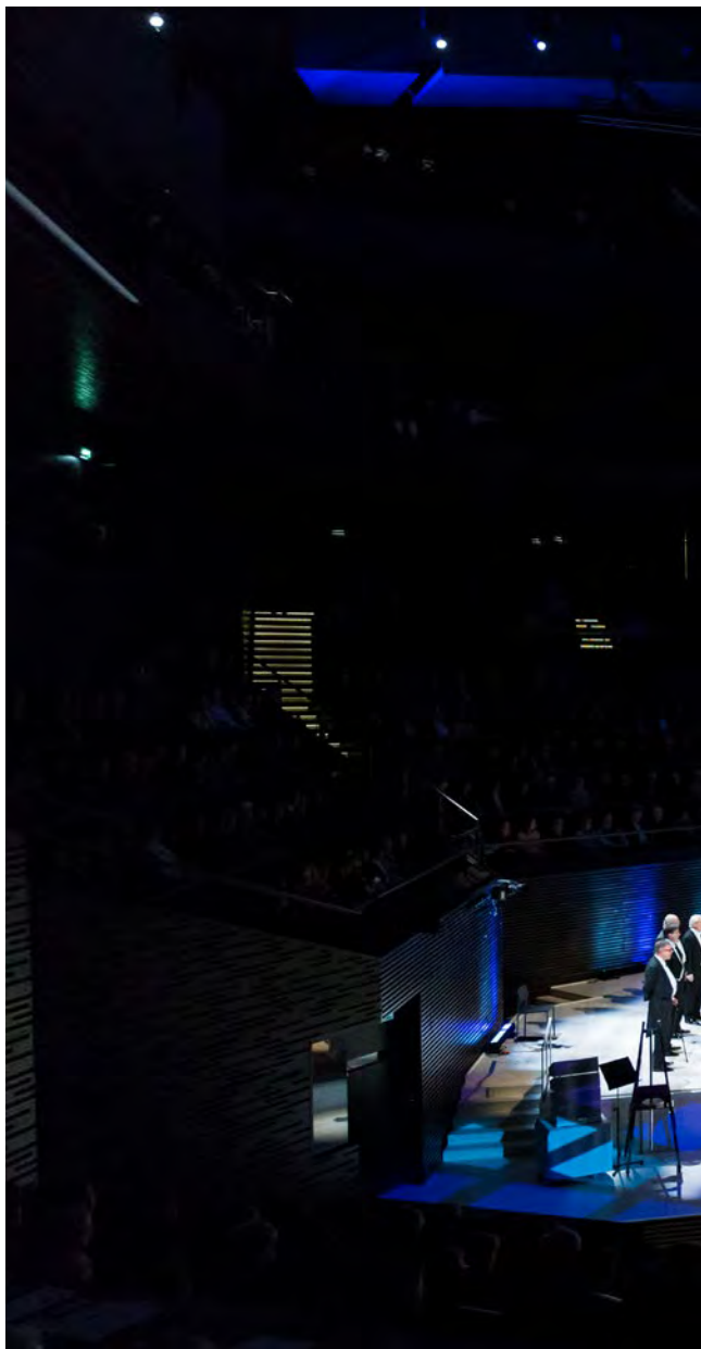
Laulu-Miehet Helsingin Musiikkitalossa

Lähimenneisyyden taiteelliset näytöt riittävät pitämään laulukunnan nimen vuosikymmeniä hakukoneita käyttävien alan miesten ja naisten, tutkijoiden, konserttijärjestäjien, managerien ja mieskuoromusiikin ystävien näytöillä.