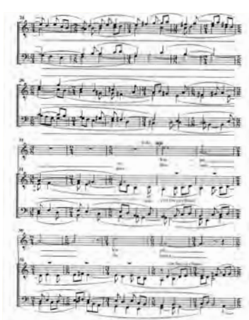
Einojuhani Rautavaara, Lehdet lehtiä 1979