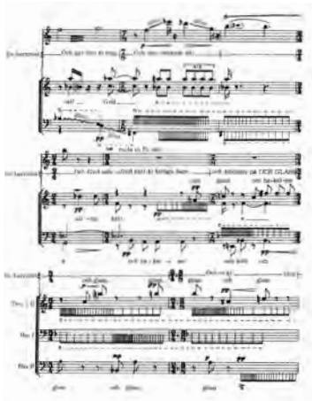
Erik Bergman, Barnets dröm 1963

Meillä kansallisromantiikka sen sijaan vain paransi tahtiaan ja oli vielä 1940-luvulle tultaessa täydessä kasvuvaiheessa. Omaäänisiä säveltäjiä riitti, musiikillinen kieli monipuolistui ja sai vaikutteita. Luovaan säveltaiteeseemme ulkoapäin hiipinyt muutosvaatimus oli kuitenkin jo repimässä railoa uudistusmielisten ja traditionalistien välille. Kasvava paine oli pian johtamassa täysin ennakoinnattomaan ja ylimitoitettuun reagointiin.